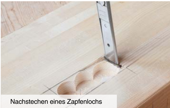
Nachstechen eines Zapfenlochs