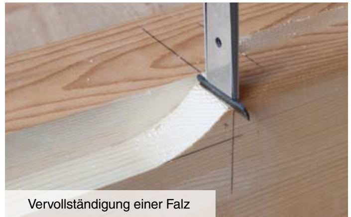
Vervollständigung einer Falz