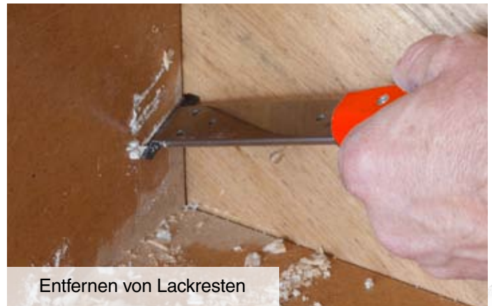
Entfernen von Lackresten