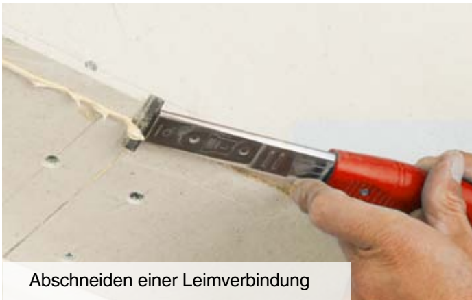
Abschneiden einer Leimverbindung