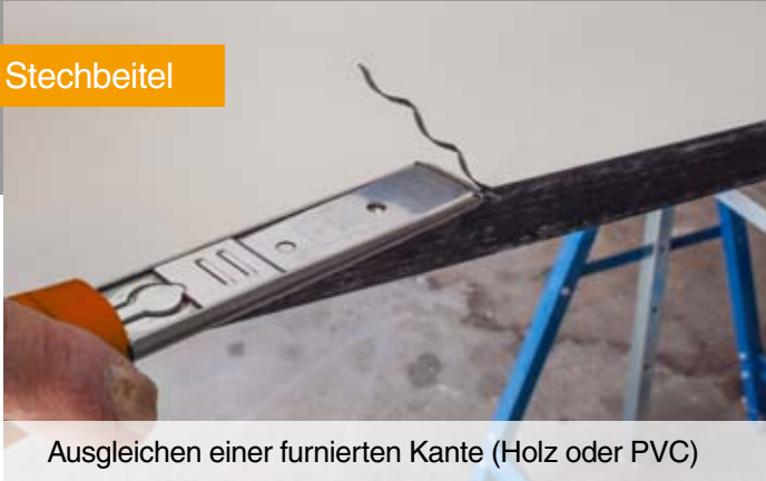
Ausgleichen einer furnierten Kante (Holz oder PVC)