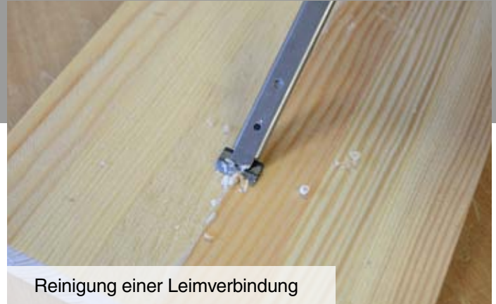
Reinigung einer Leimverbindung